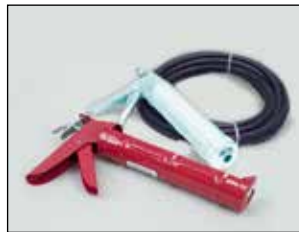
MC-1 수동 도포용 도구.