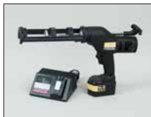
846-1E T-85 및 T-80 열전달 컴파운드 전지식 카트리지 도포용 도구 전지 팩 및 120 Vac 충전기 포함

C001 T2SSB 또는 T3SSB 밴딩에 장력을 가하기 위한 밴딩 도구.